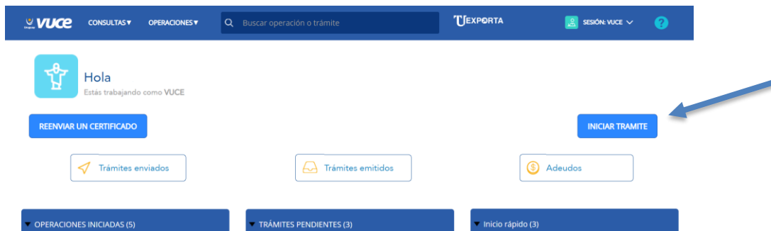
Figura 1. Inicio de trámite.

Para realizar cualquier operación en VUCE deberá presionar el botón “Iniciar Trámite”.